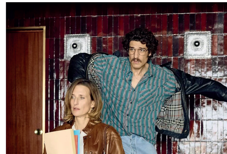
Juste une illusion Olivier Nakache et Éric Toledano, 2026